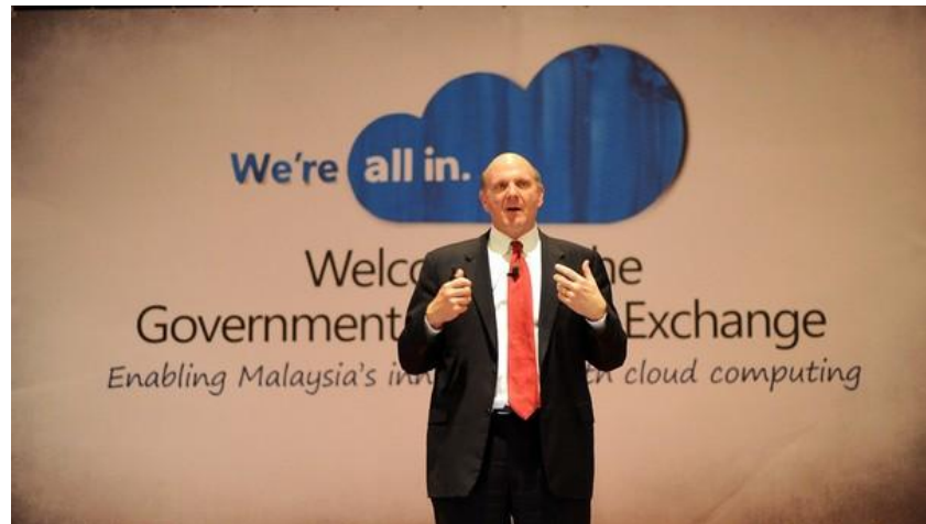
Steven Ballmer, presidente executivo da Microsoft.