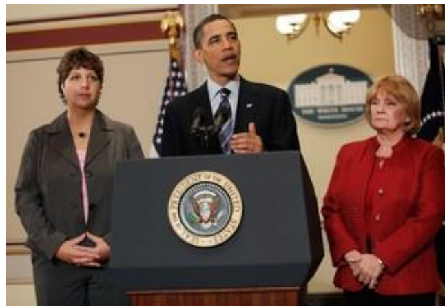
Barack Obama, presidente dos EUA e comissão.